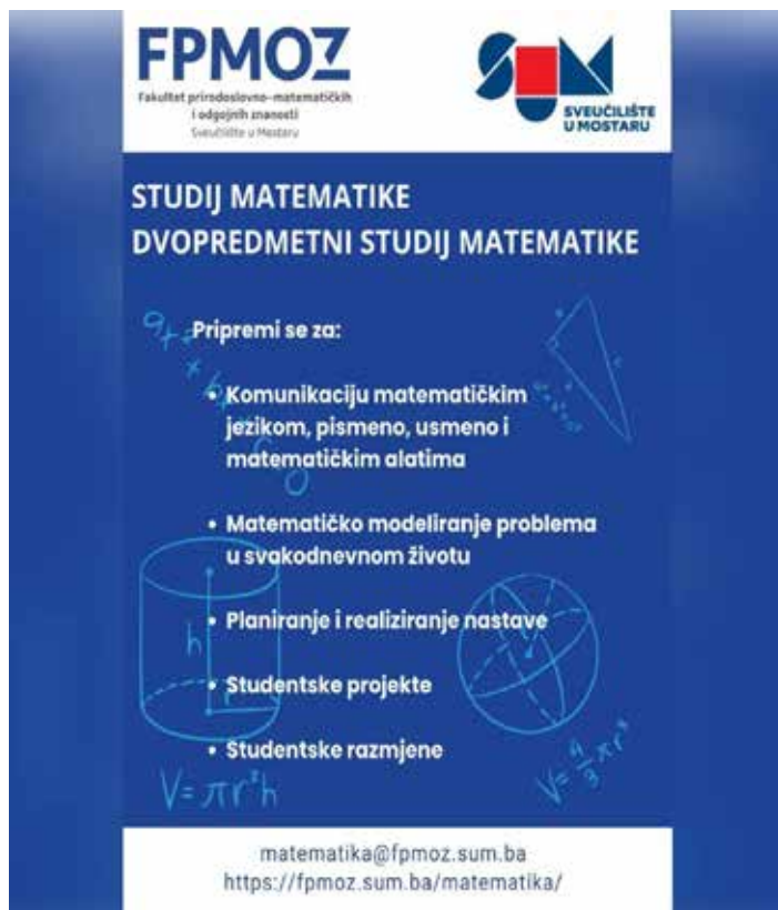
Slika 11. Matematika. 18

Matematika je temeljna znanost tradicionalno povezana s fizikom i tehničkim znanostima. U novije vrijeme uključena je u razvoj informatičkih tehnologija i sve više u ekonomiju, medicinu i druge znanosti. Dugi niz godina studij Matematika se, izuzev kao jednopredmetni studij, realizira i u kombinaciji s drugim studijskim grupama. Konceptcija studija podrazumijeva stjecanje znanja, vještina i navika realiziranih kroz niz različitih kolegija koji obuhvaćaju potreban broj sati predavanja, seminara i vježbi. Cilj ovoga studija je osposobljavanje studenata za uspješno i društveno odgovorno prenošenje matematičkog znanja na mlade naraštaje.