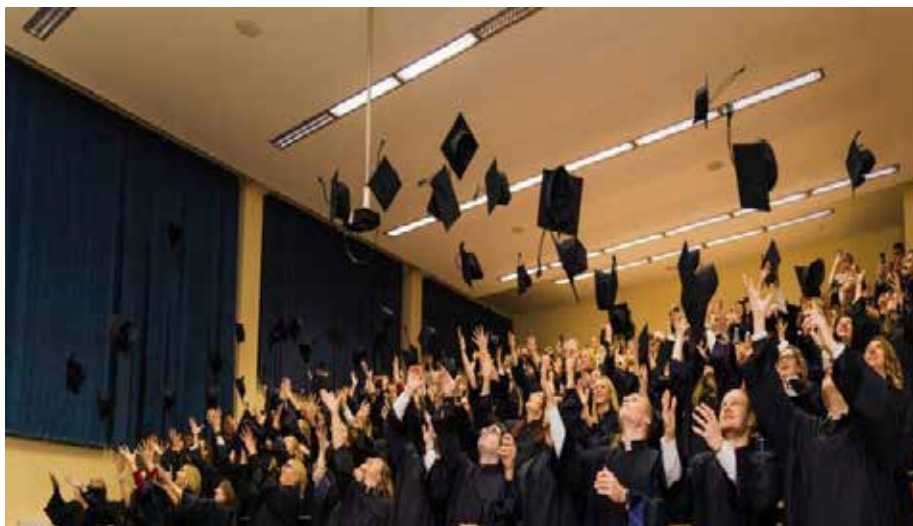
Slika 25. Svečana promocija studenata FPMOZ .