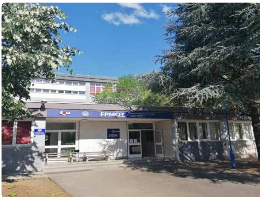
Slika 2. FPMOZ na adresi Rodoč b. b. – Kampus Rodoč.

Fakultet posjeduje dvije knjižnice, jednu u Mostaru i jednu u Rodoču, u kojima se nalazi knjižnični fond, dvije manje prostorije s literaturom na stranim jezicima, kartoteka i kopirnica, čitaonica s mogućim individualnim vježbanjem za glazbu (Rodoč).