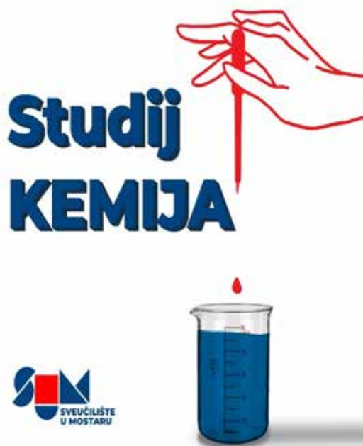
Slika 9. Kemija . 16

Studij Kemije (3+2) osigurava obrazovanje visokostručno-nastavnog i znanstveno-istraživačkoga kadra koji se može uključiti u obrazovne procese, znanstvenoistraživački rad, industriju i druge privredne te gospodarske djelatnosti. Diplomski studij Analitička kemija i biokemija omogućava studentima specijalizaciju u kontrolnim i istraživačkim laboratorijima kemijske, biokemijske, prehrambene, farmaceutske i drugih srodnih industrija, te u biološkim laboratorijima čija je problematika zaštita i monitoring okoliša; u proizvodnim i uslužnim djelatnostima gdje su potrebna znanja o postupcima i tehnikama kemijske analize; u tijelima državne uprave u području kemije, medicine i okoliša, institucijama koje se bave standardizacijom i kontrolom kvalitete; te da mogu aktivno sudjelovati u projektima osiguranja i kontrole kvalitete procesa, proizvoda i okoliša, te u postupcima akreditacije analitičkih laboratorija.