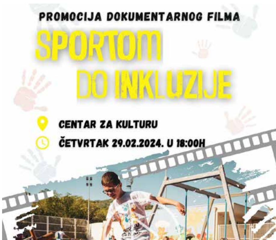
Slika 22. Sportom do inkluzije. 27