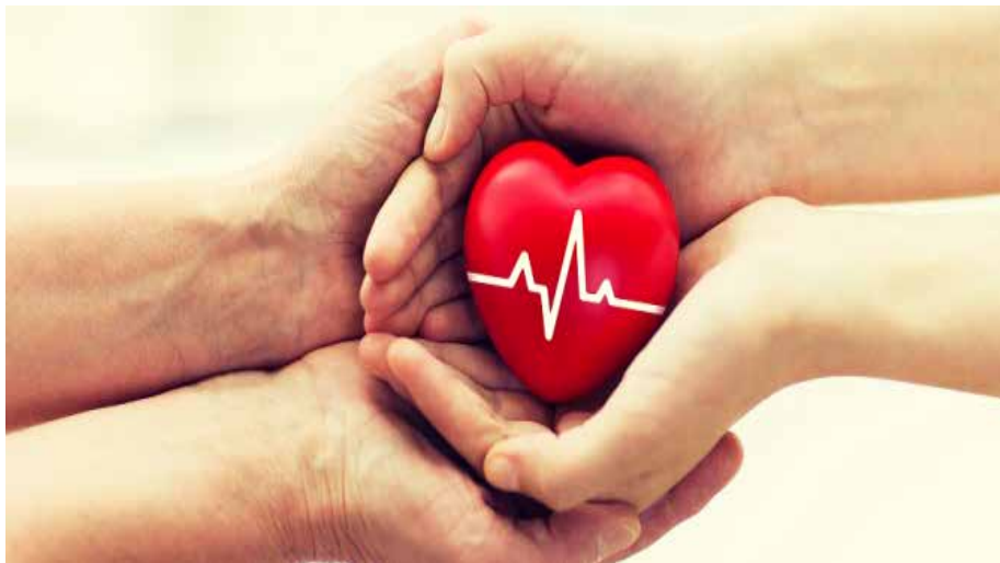
Slika 16. Akcija dobrovoljnog darivanja krvi. 23

Akcija dobrovoljnog darivanja krvi na Fakultetu prirodoslovno-matematičkih i odgojnih znanosti u organizaciji Studentskog zbora FP MOZ te u suradnji s Transfuzijskim centrom Sveučilišne kliničke bolnice Mostar održala se 14. svibnja i 3. prosinca 2024. godine, u terminu od 10:00 do 12:00 sati u plesnoj dvorani kampusa Rodoč.