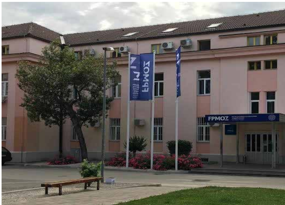
Slika 1. FPMOZ na adresi Matice hrvatske b. b. – Kampus Mostar.

Fakultet prirodoslovno-matematičkih i odgojnih znanosti Sveučilišta u Mostaru raspolaže prostorom na dvije lokacije: