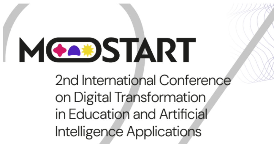
Slika 17. Druga međunarodna konferencija MoStar . 24