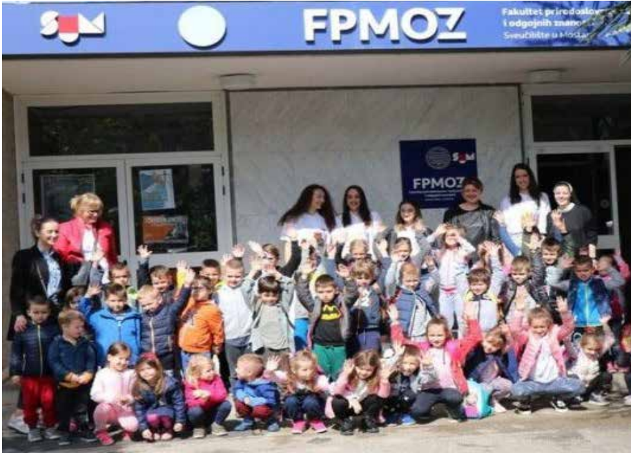
Slika 13. Predškolski odgoj. 20

Djelatnost ranoga i predškolskoga odgoja obuhvaća odgoj, obrazovanje i skrb o djeci predškolske dobi, a ostvaruje se programima odgoja, obrazovanja, zdravstvene zaštite, prehrane i socijalne skrbi za djecu od šest mjeseci do polaska u osnovnu školu. Studij Predškolskog odgoja (4+1) na temelju stečenih kompetencija osposobljava studente za stručni odgoj i obrazovanje djece rane i predškolske dobi, što uključuje njegu i brigu za zdravlje, pripremu djece za školu u različitim odgojno-obrazovnim predškolskim programima te programima izobrazbe roditelja. Također, osposobljava za obavljanje mentorstva u dječjim vrtićima, vježbaonicama za studente i sudjelovanje u realizaciji programa i projekata stručno-pedagoških službi predškolske institucije, kao što su programi cjeloživotnoga usavršavanja odgojitelja, komunikacija predškolske institucije s javnošću, te sudjelovanje u istraživačkim projektima.