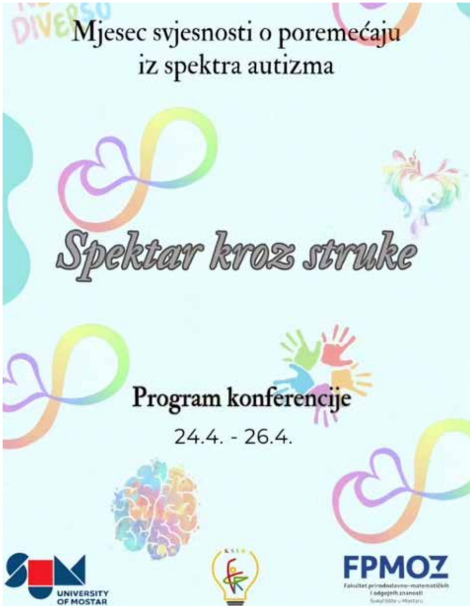
Slika 18. Konferencija Spektar kroz struke .