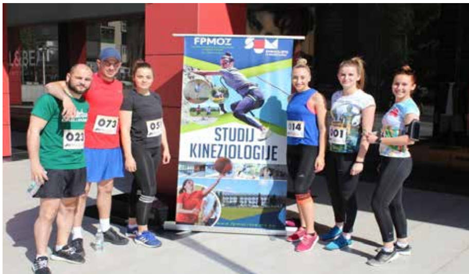
Slika 10. Kineziologija – sveučilišni i stručni studij. 17

Kineziologija (4+1), kao dio opće kulture, označava sveukupnost materijalnih i duhovnih dobara, dostignuća i aktivnosti društva usmjerenih prema razvoju čovjeka i podizanju njegova zdravlja te zadovoljavanju njegovih potreba putem motoričkih aktivnosti. Kineziologija kao stručna, ali i znanstvena disciplina, neizostavno je prisutna u čovjekovu svakodnevnu životu i radu. Primarni cilj studija kineziologije je osposobljavanje kompetentnih kadrova za izvedbu nastave tjelesne i zdravstvene kulture na svim stupnjevima odgoja i obrazovanja te osposobljavanje kompetentnih kadrova za rad u području sporta i rekreacije.