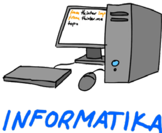
Slika 8. Informatika. 15

U novije vrijeme razvoj informatičkih tehnologija sve više utječe na društvo u cjelini, npr. ekonomiju, medicinu i druge znanosti. Na studiju Informatika (3+2) stručni se sadržaji dopunjuju metodičkim i pedagoško-psihološkim sadržajima. Cilj ovoga studija je osposobljavanje studenata za uspješno i društveno odgovorno prenošenje informatičkoga znanja na mlade naraštaje, uz samostalno korištenje najnovije računalne tehnologije u pripadajućim i raznolikim informatičkim primjenama. Nastavni plan i program se bazira na praktičnom rješavanju problema uz pomoć programskih jezika kao što je Python , Java i C/C++ s naglaskom na otvorene tehnologije. Studenti imaju mogućnost upoznati se s programskim okvirima za razvoj igrica kao što su PyGame i Phaser.io , naučiti kako napraviti web stranicu te istu postaviti na poslužitelj, naučiti programske jezike za upravljanje podacima kao što je SQL , te u konačnici i naučiti kako postati programer i kako razmišlja računalni znanstvenik.