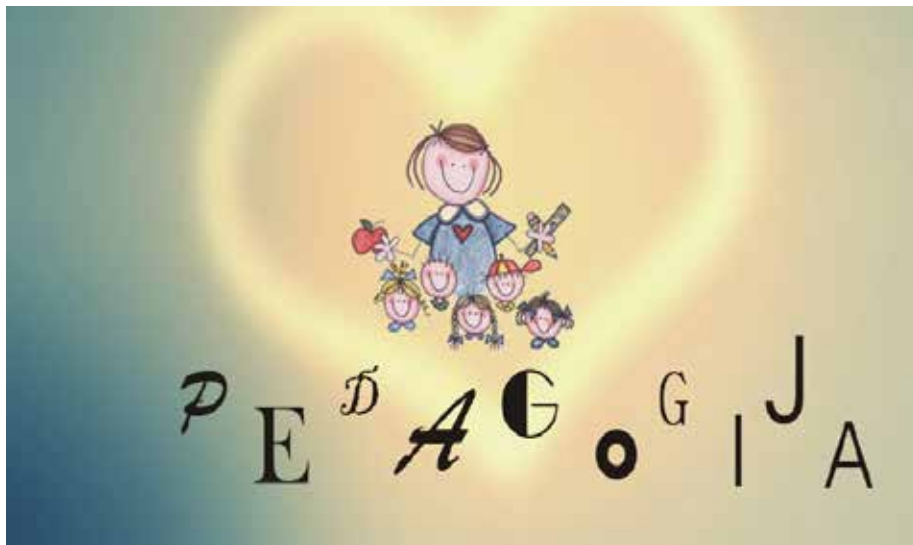
Slika 12. Pedagogija . 19

Pedagogija (3+2) je društvena znanost koja proučava, istražuje i unaprjeđuje odgoj i obrazovanje, te proučava različite utjecaje na individualni i socijalni razvoj kao i druge čimbenike, procese i sadržaje oblikovanja ljudske osobnosti i identiteta. Glavni je cilj studija omogućiti studentima stjecanje kompetencija za kvalificirano obavljanje djelatnosti pedagoga u javnim i privatnim odgojno-obrazovnim ustanovama (dječjim vrtićima, školama, savjetovalištima, domovima, ustanovama za organiziranje slobodna vremena, zavodima za zapošljavanje, andragoškim službama, centrima za obrazovnu i profesionalnu orijentaciju...), te upoznati ih s osnovnim odrednicama pedagogije, odgojno-obrazovnoga/školskoga sustava, kao i s multidisciplinarnim karakterom pedagojske znanosti.