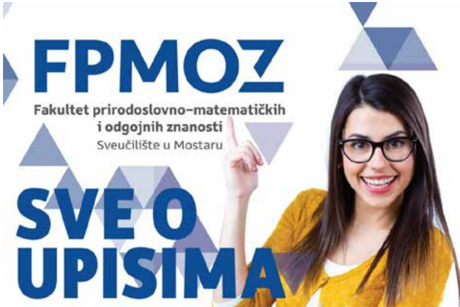
Slika 3. FPMOZ – Sve o upisima.

Na Fakultetu prirodoslovno-matematičkih i odgojnih znanosti , u odnosu na postavljene sveučilišne strateške ciljeve, nastava je osnovna djelatnost od osamostaljenja akademske 2005./2006. godine. Posljednjih godina, nastavni je proces doživio brojne promjene u sklopu implementacije Bolonjskog procesa , te je tim povodom, a i obvezom da se svake četiri godine radi revizija, započet transparentan i dosljedan postupak revizije te unapređenja studijskih programa uz sudjelovanje studenata i drugih potrebnih dionika, čime su se dosljedno alocirali ECTS bodovi, preko definiranoga sustava ECTS koordinacije, na svim razinama, te i ažurirali popisi izbornih predmeta za sveučilišnu bazu predmeta s općim kompetencijama koje mogu birati studenti svih studijskih programa.