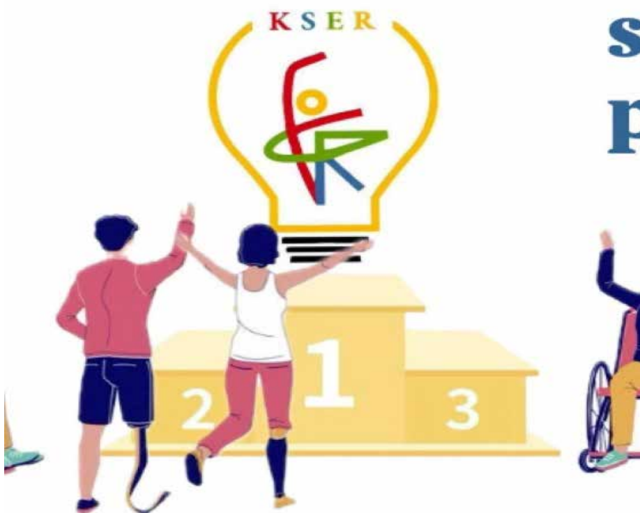
Slika 5. Klub studenata edukacijske rehabilitacije ERGO. 12

Edukacijska rehabilitacija (3+2) se temelji na znanjima iz interdisciplinarnog područja edukacijsko-rehabilitacijskih znanosti pod kojima se podrazumijevaju procesi i funkcije povezane s oštećenjima vida, s teškoćama učenja, s deficitom pažnje / hiperaktivnim poremećajem ( ADHD ), s intelektualnim teškoćama, s poremećajima iz spektra autizma, s višestrukim teškoćama, s motoričkim poremećajima, s kroničnim bolestima, s kreativnim i art / ekspresivnim terapijama. Pored navedenoga, na studiju se usvaja suvremeni pristup invaliditetu u kontekstu ljudskih prava i razvija se razumijevanje invaliditeta kao posljedice međudjelovanja oštećenja i utjecaja socijalnog konteksta. Usvajaju se znanja potrebna za razumijevanje i funkcioniranje djece s teškoćama u razvoju i odraslih osoba s invaliditetom u različitim okruženjima.