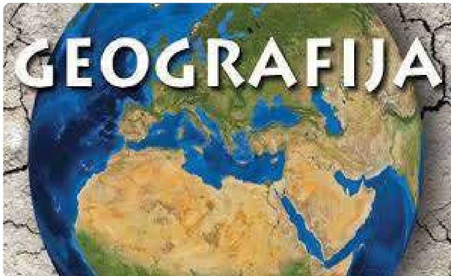
Slika 6. Geografija. 13

Geografija (3+2) je znanost koja se bavi proučavanjem međudnosa ljudi i njihova okoliša te stoga ona predstavlja most između prirode i društva. Studij ukazuje na to da su informacije (naglasak je na geografskom informacijskom sustavu) jedan od ključnih resursa razvoja te da je problematika prostornog i regionalnog razvoja interdisciplinarno područje u kojem geografija, posebno primijenjena, ima stožernu ulogu. Kandidati koji završe diplomski studij smjera Turizam i zaštita okoliša ili Održivi razvoj turizma (potonji se realizira samo kao diplomski), biti će osposobljeni za obavljanje poslova znanstveno-istraživačkih i stručnih suradnika u znanstvenim i znanstveno-istraživačkim, kulturnim, školskim i drugim javnim institucijama kao i u institucijama od općedruštvenog značaja u turističkim djelatnostima na gradskoj (ili općinskoj), županijskoj, regionalnoj i državnoj razini te u inozemstvu.