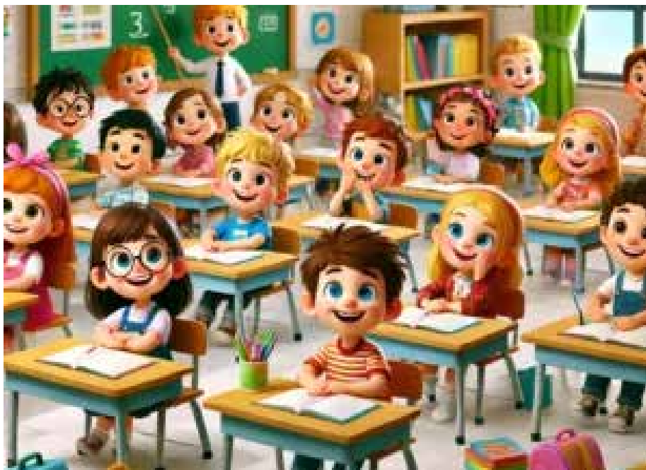
Slika 14. Razredna nastava. 21

Razredna nastava (4+1; 3+2) je rezultat objektivnih društvenih, kulturnih, političkih i gospodarskih potreba koje su utvrđene na osnovi analize postojećega stanja u bosanskohercegovačkom školskom sustavu na hrvatskom jeziku i sagledavanja perspektive njegova razvoja. Cilj je studija osposobljavanje studenata za uspješno društveno i odgovorno prenošenje znanja na mlade naraštaje, uz samostalnu uporabu najnovije informatičke tehnologije u pripadajućim odgojnim primjenama. Kroz didaktičku i metodičku praksu studenti se osposobljavaju u skladu s pravcima, načelima i zakonitostima dječjega razvoja kao i temeljnim znanjima iz općih predmeta. Način studiranja i programi usklađeni su s europskim zemljama što predstavlja imperativ kako bi se poboljšala kvaliteta njegova ishoda