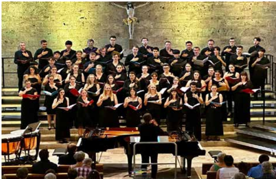
Slika 7. Studenti studija Glazbe FPMOZ SUM i Zbor Duman iz Livna na zbornom susretu C. H. O. I. R. 2024 u Ochsenhausenu – Njemačka. 14

Glazba (4+1) uključuje mnoga zanimanja: glazbene pedagoge, teoretičare, solo pjevače, instrumentaliste (klaviriste, violiniste, flautiste, gitariste, klasične harmonikaše...) – nastavnike i profesore u osnovnim i srednjim glazbenim školama, glazbenim akademijama; te (etno)muzikologe, znanstvenike koji se bave proučavanjem tradicijske i glazbene kulture cijeloga svijeta. Studij izvodi dva programa, i to program Glazbene pedagogije s teorijskim smjerovima koji se biraju na četvrtoj godini preddiplomskog studija (1. Glazbena kultura ; 2. Glazbena kultura i etnomuzikologija ; 3. Glazbena kultura i glazbena teorija ), te program Glazbene umjetnosti s instrumentalnim smjerovima i solo pjevanjem.