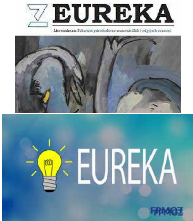
Slika 22. Časopis Eureka . 19

Riječ je o časopisu studenata Fakulteta prirodoslovnih-matematičkih i odgojnih znanosti Sveučilišta u Mostaru koji je započeo s radom 2009., te uz kratku stanku, kontinuirano nastavlja svoju djelatnost od 2016. godine do danas izdajući jedan ili dva broja godišnje. Časopis donosi različite priče, aktivnosti i projekte sa svih studija Fakulteta , ali i razgovore s predstavnicima Fakulteta i studentima, te stručne teme. Sva izdanja Eureka dostupna su i u pdf formatu, a od akademske 2020./2021. godine časopis je dostupan i putem web stranice https://eureka.fpmoz.sum.ba koju su izradili i održavaju studenti studija Informatike, odnosno članovi Udruge Switch .