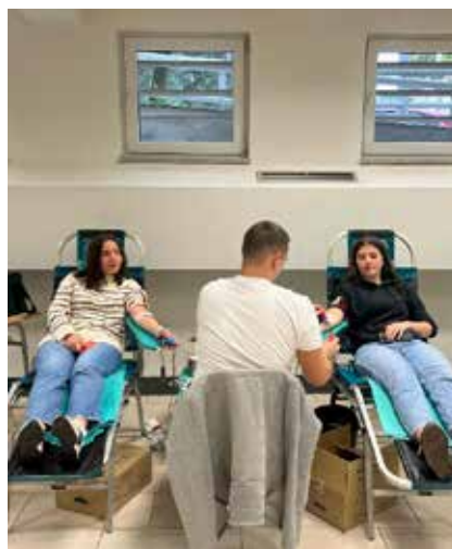
Slika 21. Akcija darivanja krvi .

AKCIJA DOBROVOLJNOG DARIVANJA KRVI , održana je 24. siječnja 2023. godine u terminu od 10:00 do 12:00 sati na FPMOZ-u, Kampus Rodoč.