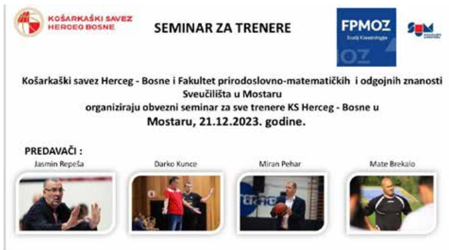
Slika 27. Seminar za trenere – Kampus Rodoč.

RADIONICE za nastavnike fizike osnovnih i srednjih škola ŽZH u sklopu projekta Kurikularne reforme osnovnog i srednjeg obrazovanja , održane 29. i 30. prosinca 2023. godine u OŠ Ruđera Boškovića u Grudama / (29. 12.) Teme: Kurikulska reforma i ishodi učenja; Vrednovanje prema ishodima učenja i elementima vrednovanja / (30. 12.) Teme: Tematsko planiranje; Planiranje i pisanje GIK-a / Organizator: Zavod za odgoj i obrazovanje ŽZH / Voditelj radionica: doc. dr. sc. Jadranko Batišta / Fizika