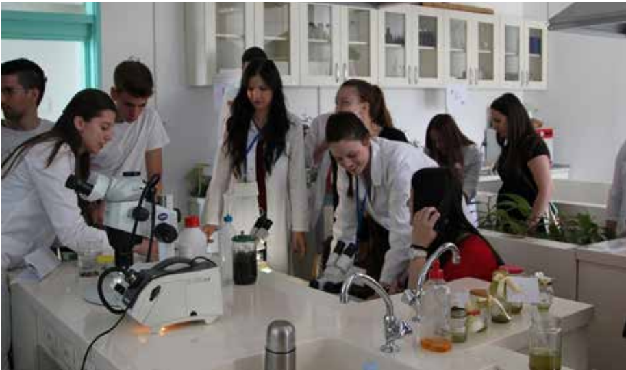
Slika 1. Laboratorij biologije.

Sveučilišni studij Biologije (3+2) nudi mogućnost upoznavanja sustava od molekule do živog bića u prirodnom okolišu, upoznavanja i razumijevanja stanica kao osnovnih jedinica života, otkrivanja tajnih nasljeđivanja i raznolikosti životnih oblika na Zemlji. S ciljem stjecanja praktičnih vještina i razvitka kreativnih sposobnosti eksperimentalni rad u laboratorijima i terenska nastava su zastupljeni