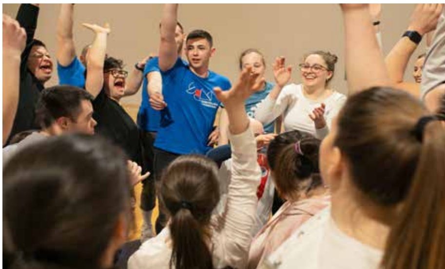
Slika 26. Studenti Kineziologije – Klub studenata edukacijske rehabilitacije ERGO – Udruga Down sindrom Mostar . 21