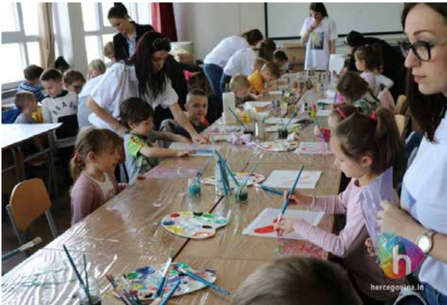
Slika 13. Likovna radionica s djecom predškolske dobi.