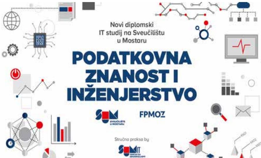
Slika 8. Novi diplomski smjer Podatkovna znanost i inženjerstvo .