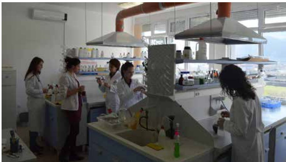
Slika 9. Laboratorij kemije.