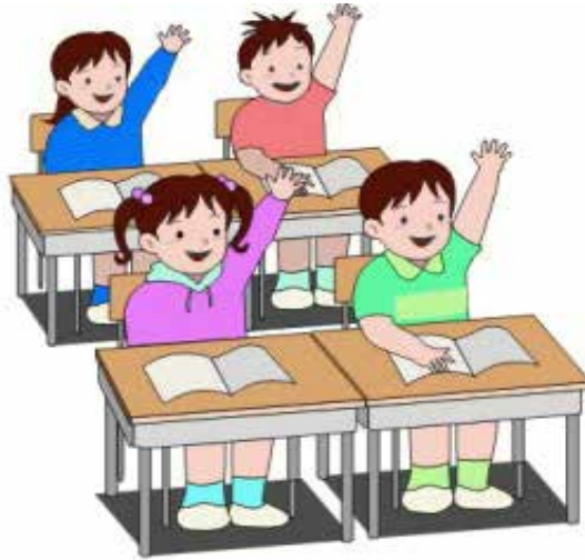
Slika 14. U učionici – Razredna nastava. 11