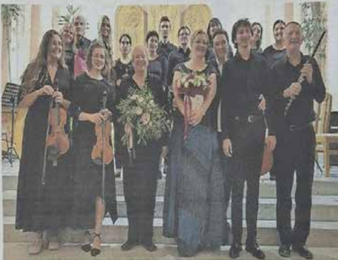
OVO GLAZBENO FOTOGRAFIJE izloženo je izložba za učitelje i studente u sarajevu i izvrsni koncert, svaki dan, u svim područjima kulture i umjetnosti na svim profesionalnim glazbenim i vokalnim područjima.