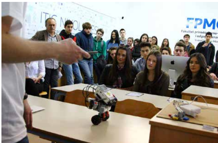
Slika 17. Robotika.