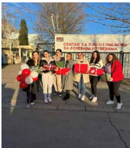
Slika 20. Klub studenata Predškolskog odgoja – Paket ljubavi .

U siječnju i studenom 2023. godine, Studentski zbor je organizirao Akciju dobrovoljnog darivanja krvi u suradnji s Transfuzijskim centrom Sveučilišne kliničke bolnice Mostar , a u prosincu su studenti organizirali Božićnu humanitarnu akciju za pomoć onima kojima je najpotrebnija.