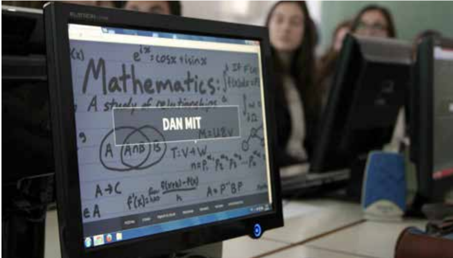
Slika 11. Studij Matematike .

Matematika (3+2) je temeljna znanost tradicionalno povezana s fizikom i tehničkim znanostima. U novije vrijeme uključena je u razvoj informatičkih tehnologija i sve više u ekonomiju, medicinu i druge znanosti. Konceptcija studija podrazumijeva stjecanje znanja, vještina i navika realiziranih kroz niz različitih kolegija koji obuhvaćaju potreban broj matematičkih sati predavanja, seminara i vježbi. Cilj ovoga studija je osposobljavanje studenata za uspješno i društveno odgovorno prenošenje matematičkog znanja na mlade naraštaje.