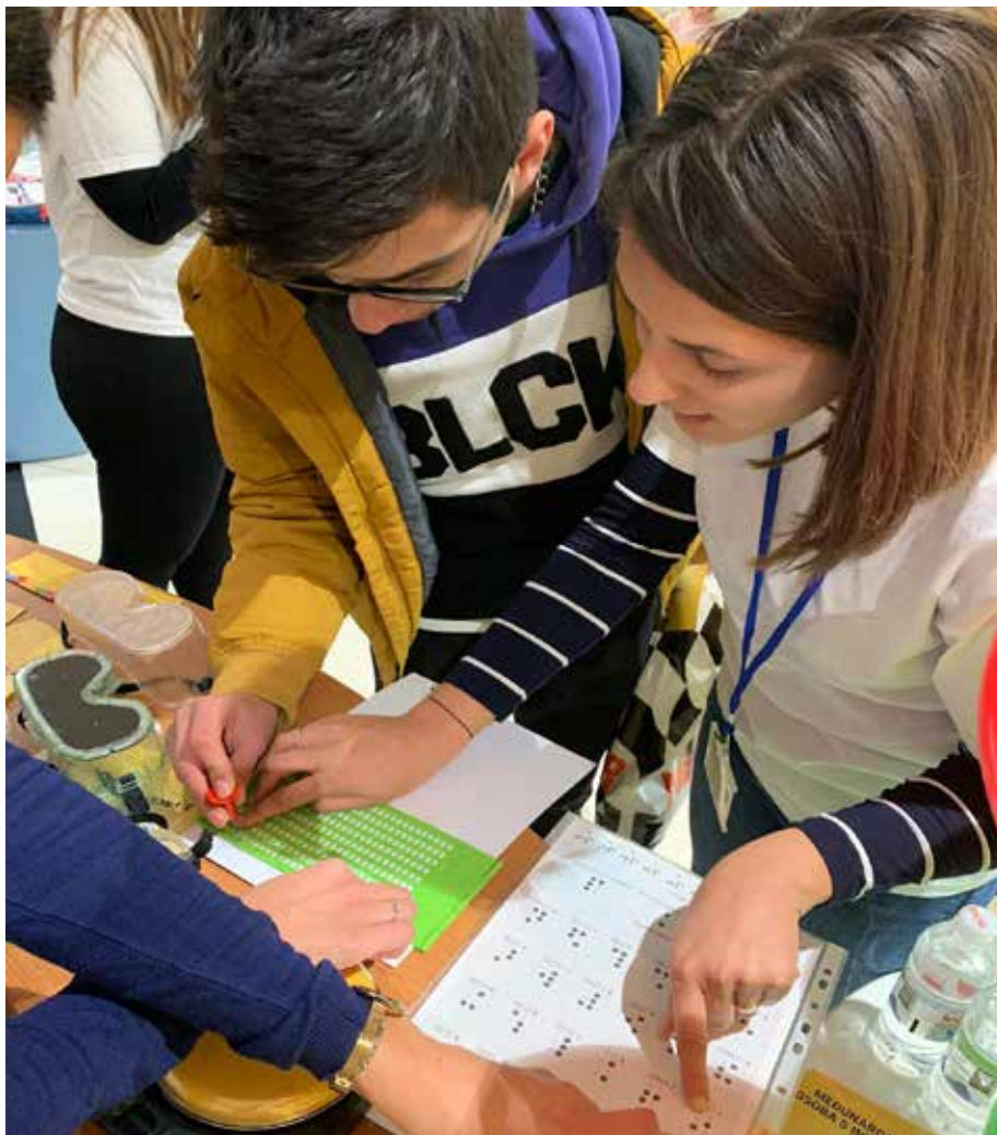
Slika 2. Braillevo pismo.

Studij Edukacijska rehabilitacija (3+2) se temelji na znanjima iz interdisciplinarnog područja edukacijsko-rehabilitacijskih znanosti pod kojima se podrazumijevaju procesi i funkcije povezane s oštećenjima vida, s teškoćama učenja, s deficitom pažnje / hiperaktivnim poremećajem (ADHD), s intelektualnim teškoćama, s poremećajima iz spektra autizma, s višestrukim teškoćama, s motoričkim poremećajima, s kroničnim bolestima, s kreativnim i art / ekspresivnim terapijama. Pored navedenoga, na studiju se usvaja suvremeni pristup invaliditetu u kontek-