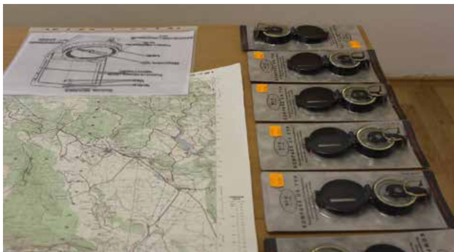
Slika 3. Pribor za geografiju.