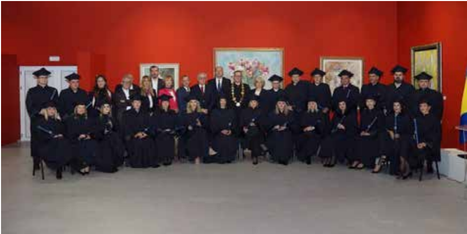
Slika 18. Promocija doktora znanosti i umjetnosti na Sveučilištu u Mostaru. 18

Za ostvarenje postavljenih ciljeva nužno je obrazovati novi, te zadržati postojeći, poglavito mladi kadar, kako bi se u budućnosti na Fakultetu mogla održavati redovita i organizirati dodatna nastava, uz poboljšanje kvalitete studija, ali i ne samo nastave nego i svih studentskih pitanja čime bi pomogli studentima u njihovim nastojanjima za stjecanjem novih znanja i tehnologija. S tim u vezi, radi se na revidiranju i osuvremenjivanju posljediplomskih doktorskih studija što bi se trebalo realizirati u sljedećoj akademskoj 2023./2024. godini. Dinamika ostvarivanja postavljenih ciljeva ide po planu i načelima koji su postavljeni za ostvarenje istih.