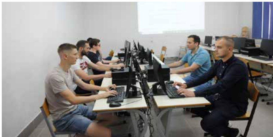
Slika 7. Računalni kabinet.

U novije vrijeme razvoj informatičkih tehnologija sve više utječe na društvo u cjelini, npr. ekonomiju, medicinu i druge znanosti. Na studiju se Informatike (3+2) stručni sadržaji dopunjuju metodičkim i pedagoško-psihološkim sadržajima. Cilj ovoga studija je osposobljavanje studenata za uspješno i društveno odgovorno prenošenje informatičkoga znanja na mlade naraštaje, uz samostalno korištenje najnovije računalne tehnologije u pripadajućim i raznolikim informatičkim primjenama. Nastavni plan i program se bazira na praktičnom rješavanju problema uz pomoć programskih jezika kao što je Python , Java i C/C++ s naglaskom na otvorene tehnologije. Studenti imaju mogućnost upoznati se s programskim okvirima za razvoj igrica kao što su PyGame i Phaser.io , naučiti kako napraviti web stranicu te istu postaviti na poslužitelj, naučiti programske jezike za upravljanje podacima kao što je SQL , te u konačnici i naučiti kako postati programer i kako razmišlja računalni znanstvenik.