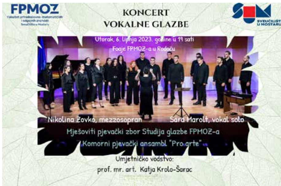
Slika 4. Koncert vokalne glazbe.

Na studiju Glazbe (4+1) mnoga od zanimanja uključuju: glazbene pedagoge, teoretičare, solo pjevače, instrumentaliste (klaviriste, violiniste, flautiste, gitariste, klasične harmonikaše) – nastavnike i profesore u osnovnim i srednjim glazbenim školama, glazbenim akademijama; te (etno)muzikologe, znanstvenike koji se bave proučavanjem tradicijske i glazbene kulture cijeloga svijeta. Studij izvodi dva programa, i to program Glazbene pedagogije s teorijskim smjerovima koji se biraju na četvrtoj godini preddiplomskog studija (1. Glazbena kultura ; 2. Glazbena kultura i etnomuzikologija ; 3. Glazbena kultura i glazbena teorija ) i gdje su prve tri godine zajedničke, te program Glazbene umjetnosti s instrumentalnim smjerovima i solo pjevanjem.