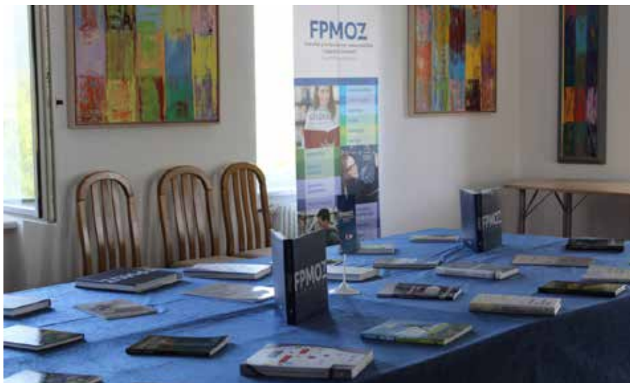
Slika 24. Promocija publikacija nastavnika FPMOZ, Rama-Ščit, 14. srpnja 2023.