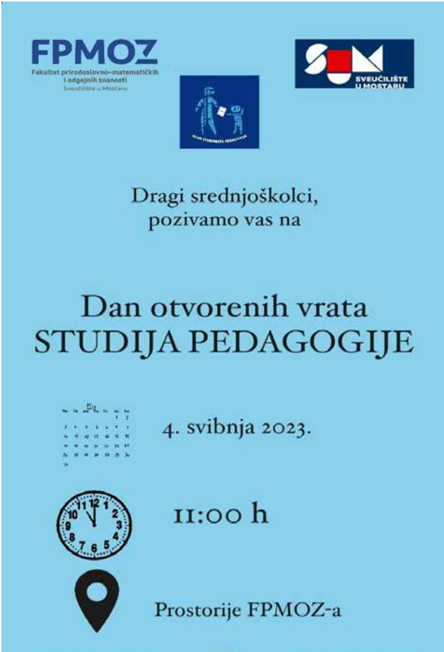
Slika 12. Dan otvorenih vrata Pedagogije.