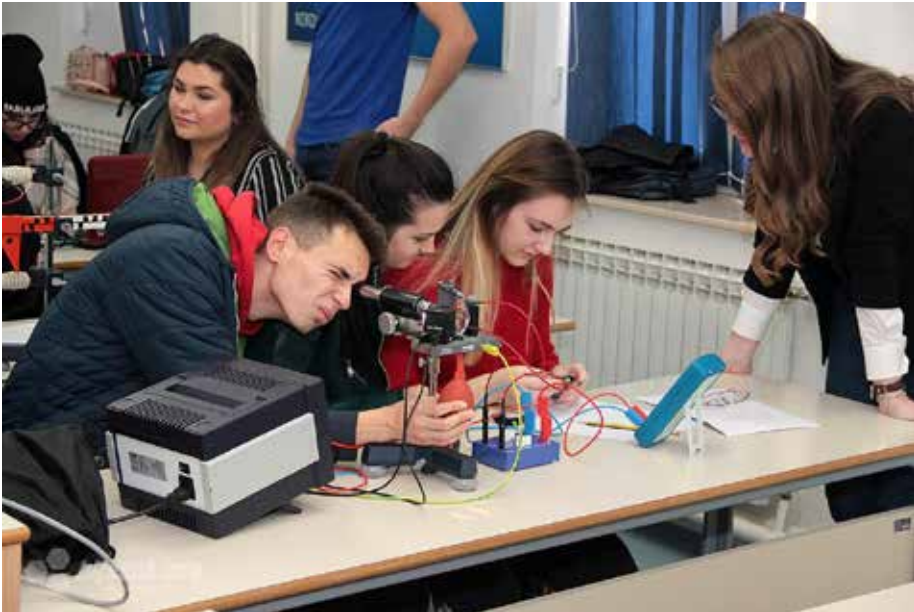
Slika 16. Dani otvorenih vrata Fizike.

Fizika (3+2) je nedvojbeno temeljna prirodna znanost koja objašnjava pojave u našem svijetu te na adekvatan način odgovara na životne potrebe današnjega dinamičkoga života. Ona je stup tehnološkoga razvoja, a kao takva daje značajnu perspektivu u budućnosti. Fizika u posljednje vrijeme sve više postaje interdisciplinarna te je njezin doprinos izrazito značajan u razvoju drugih znanosti kao što su medicina, biologija, kemija, računarstvo, tehničke znanosti... Na studiju Fizike realizira se stjecanje znanja, vještina i navika kroz niz različitih kolegija koji obuhvaćaju potreban broj sati predavanja, seminara i vježbi. Program je rađen prema programima srodnih fakulteta u Hrvatskoj, koji su usporedivi s programima isto- vjetnih studija na više vodećih europskih i američkih sveučilišta.