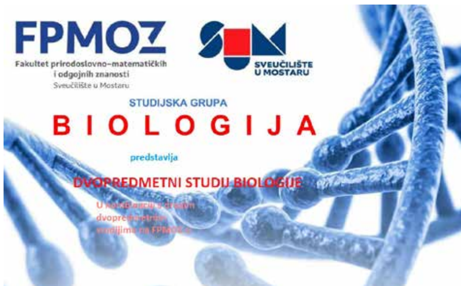
Slika 15. Biologija – dvopredmetni studij.